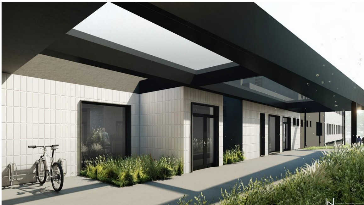
Rekonstruotas Priėmimo- skubios pagalbos skyrius.