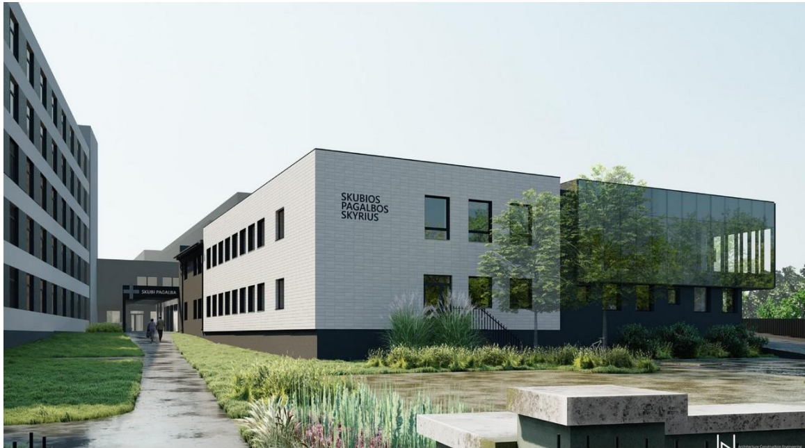
Rekonstruotas Priėmimo- skubios pagalbos skyrius.