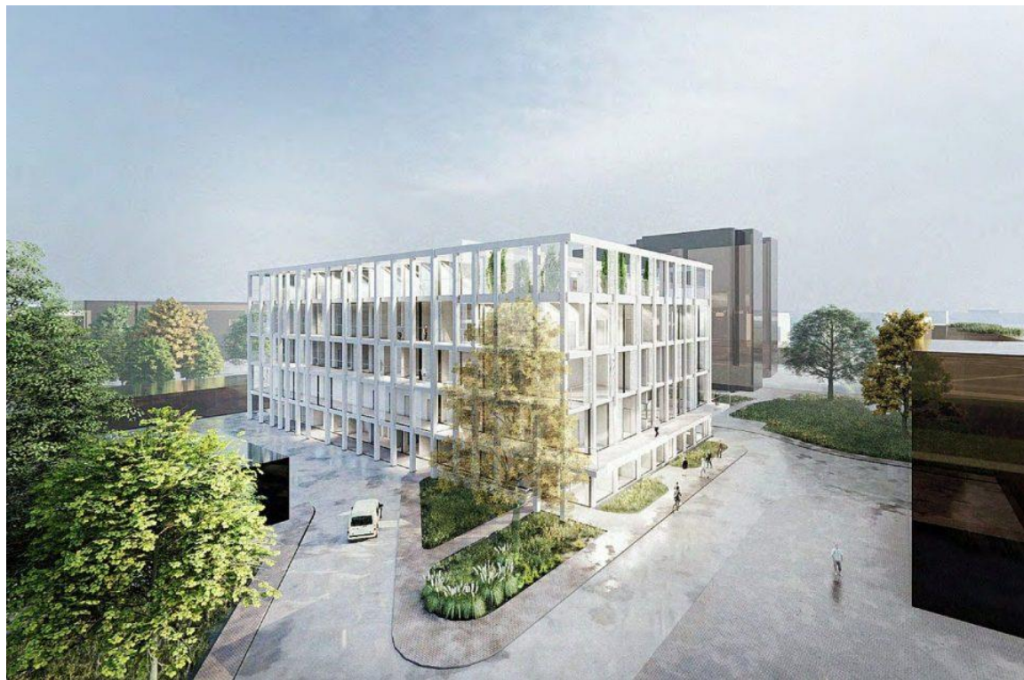
Nauja Infekcinių ligų klinika.

Projekto vykdytojas- VšĮ Respublikinė Panevėžio ligoninė.